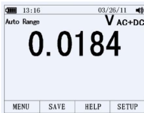
Подрежим AC + DC