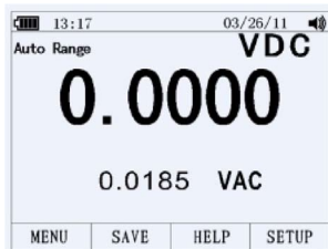
Подрежим DC AC

В режиме измерения AC– и DC–сигналов недоступны дополнительные режимы измерений: PEAK, Hz, ms, %, REL, MIN, MAX, REL .